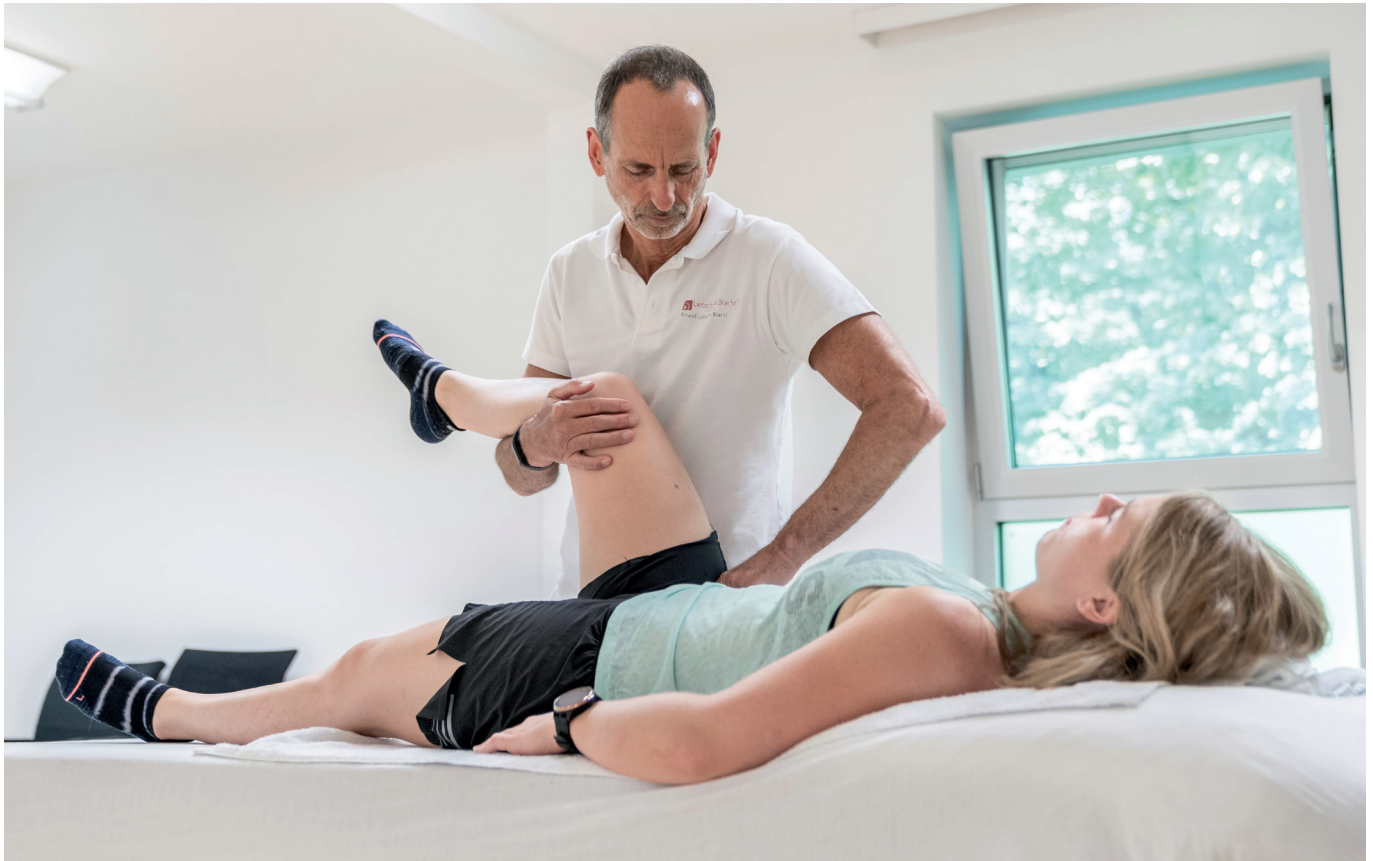
Liebscher & Bracht

Im Unfallkrankenhaus Salzburg wurde in einer interdisziplinären Pilotstudie (ohne Kontrollgruppe) ein Behandlungsschema getestet, das auf dem Schmerzmodell nach Liebscher und Bracht basiert.